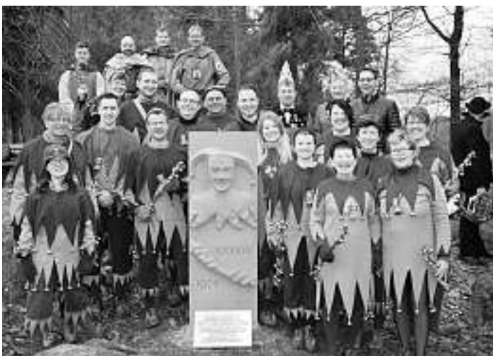
Eine Sandsteinstele am Jockele-Guck zeigt Jockele-Maske und Bengel und erinnert so an die Gründung der Jockelegruppe vor 44 Jahren.