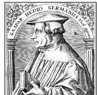
Casper Hedio, 1494 – 1552, Kupferstich 16. Jhd.

Mit dem Augsburger Religionsfrieden in Form des Gesetzes vom 25. September 1555 war für die der Landvogtei zugehörigen Orte die katholische Konfession endgültig festgelegt, denn ab diesem Zeitpunkt bestimmte der Glaube des weltlichen Landesherrn die Religionszugehörigkeit seiner Untertanen („ Ubi unus dominus, ibi una sit religio “ – „Wo ein Herr ist, dort sei eine Religion“). Die Angehörigen des