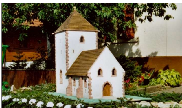
Modell der Stefanskirche Oberachern, angefertigt von Christoph Burkart (Oberachern) anlässlich dem 525-jährigen Jubiläum von Ottenhöfen 2004, auf Initiative des Heimat- und Verschönerungsvereins Oberachern e. V..