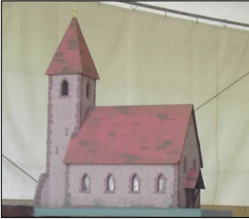
Modell der Johanneskirche, angefertigt von Christoph Burkart (Oberachern) auf Initiative des Heimat- und Verschönerungsvereins Oberachern e. V. anlässlich der 700-jährigen Ersterwähnung derselben 2006.